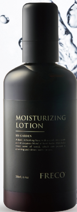
MOISTURIZING LOTION 250ml / 8.4oz