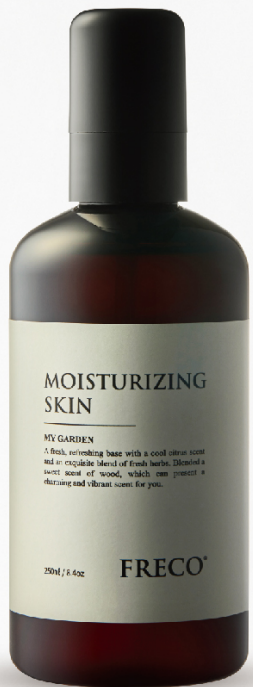
MOISTURIZING SKIN 250ml / 8.4oz