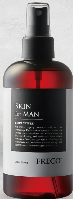
SKIN for MAN 250ml / 8.4oz