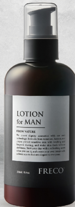
LOTION for MAN 250ml / 8.4oz