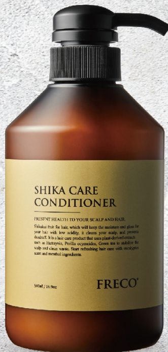
SHIKA CARE CONDITIONER 500ml / 16.9oz 2000ml / 67.62oz