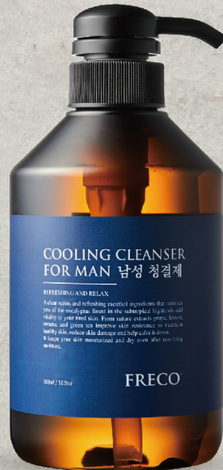
COOLING CLEANSER FOR MAN 500ml / 16.9oz