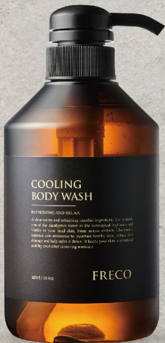
COOLING BODY WASH 500ml / 16.9oz 2000ml / 67.62oz