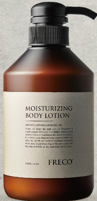
MOISTURIZING BODY LOTION 500ml / 16.9oz