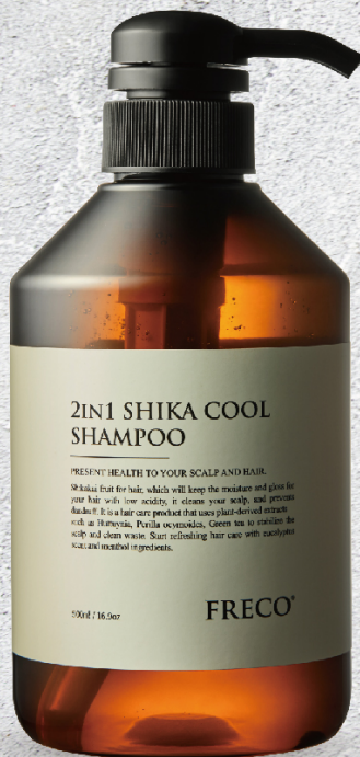
2in1 SHIKA COOL SHAMPOO 500ml / 16.9oz 2000ml / 67.62oz